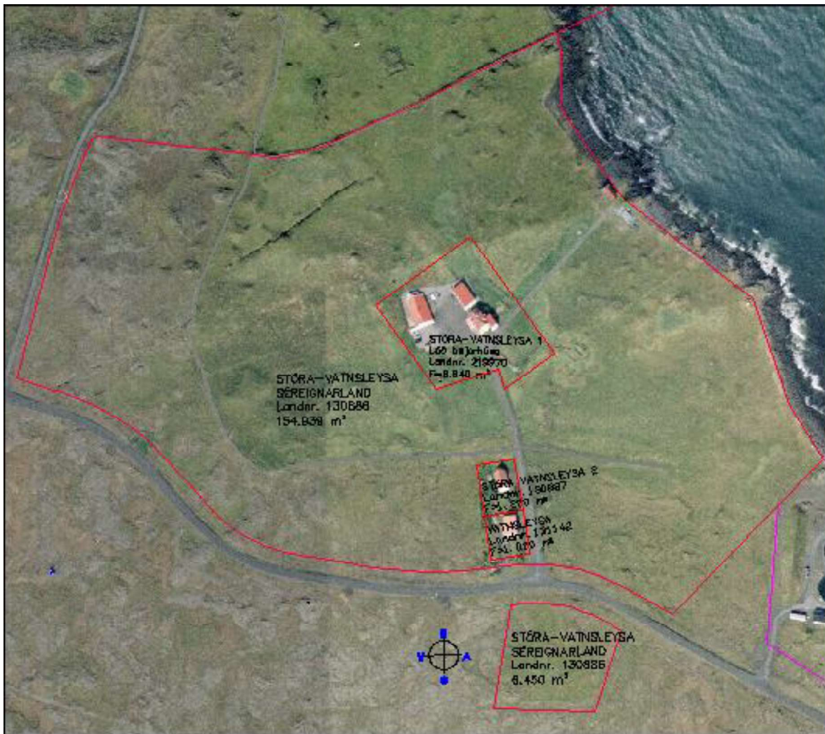
Mynd 1. Yfirlitsmynd af skipulagssvæðinu, sem sýnir séreignarland Stóru – Vatnsleysu og núverandi íbúðarhúsalóðir.