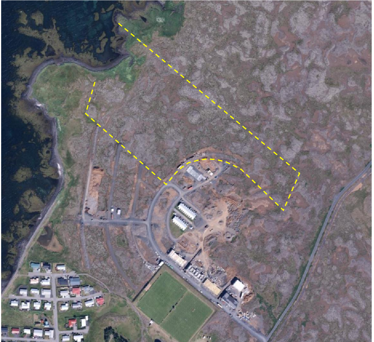
Mynd 1. Skipulagssvæðið er afmarkað með gulri punktalínu.