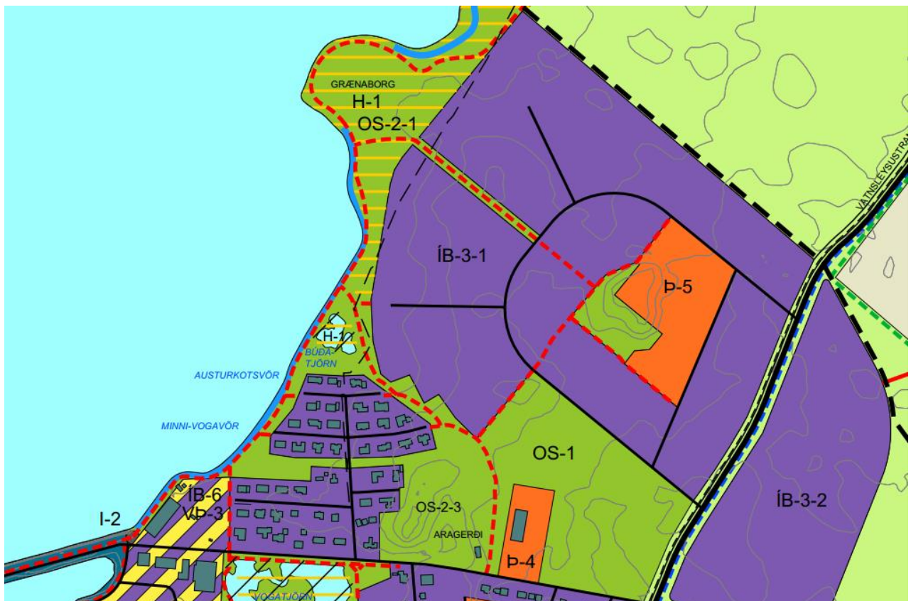
Mynd 3. Hluti þéttbýlisuppdráttar Aðalskipulags Sveitarfélagsins Voga 2008-2028. Skipulagssvæðið er fjólublátt íbúðarsvæði ÍB-3-1 og opið svæði OS-2-1.