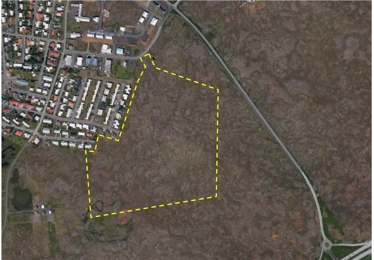
Mynd 1. Skipulagssvæðið er afmarkað með gulri punktalínu.