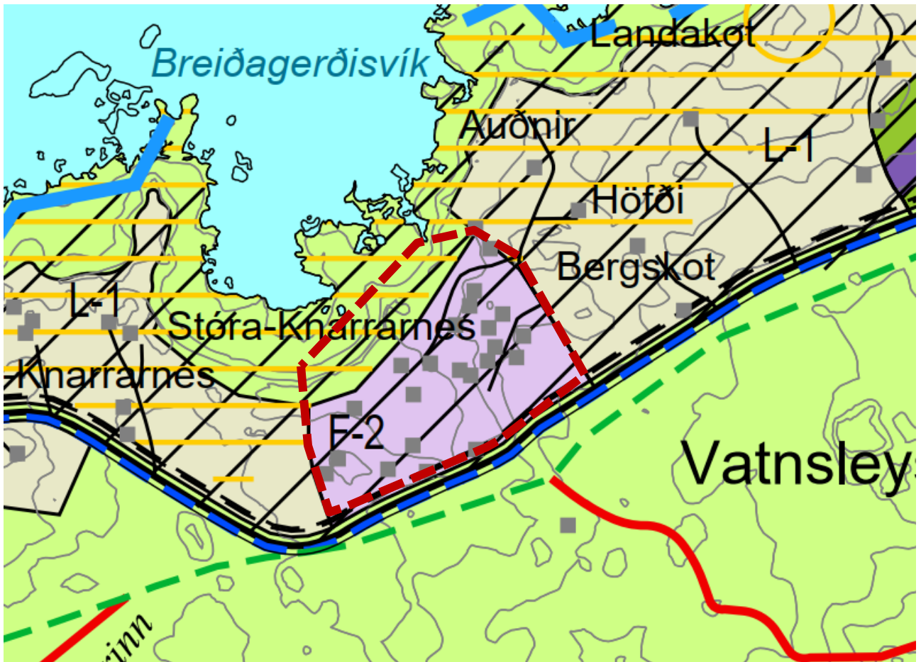
Mynd 4. Hluti dreifbýlisuppráttar Aðalskipulags Sveitarfélagsins Voga 2008-2028. Skipulagssvæðið er afmarkað með rauðri punktalínu.