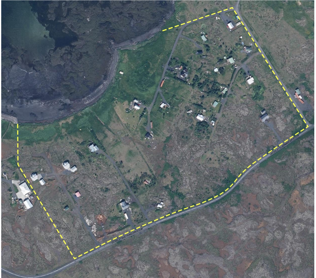
Mynd 3. Skipulagssvæðið er afmarkað með gulri punktalínu.

Eins og Vatnsleysuströndin öll er svæðið þakið hálfgrónu Þráinsskjaldarhrauni sem er forsögulegt hraun sem er um 14.100 ára gamalt.