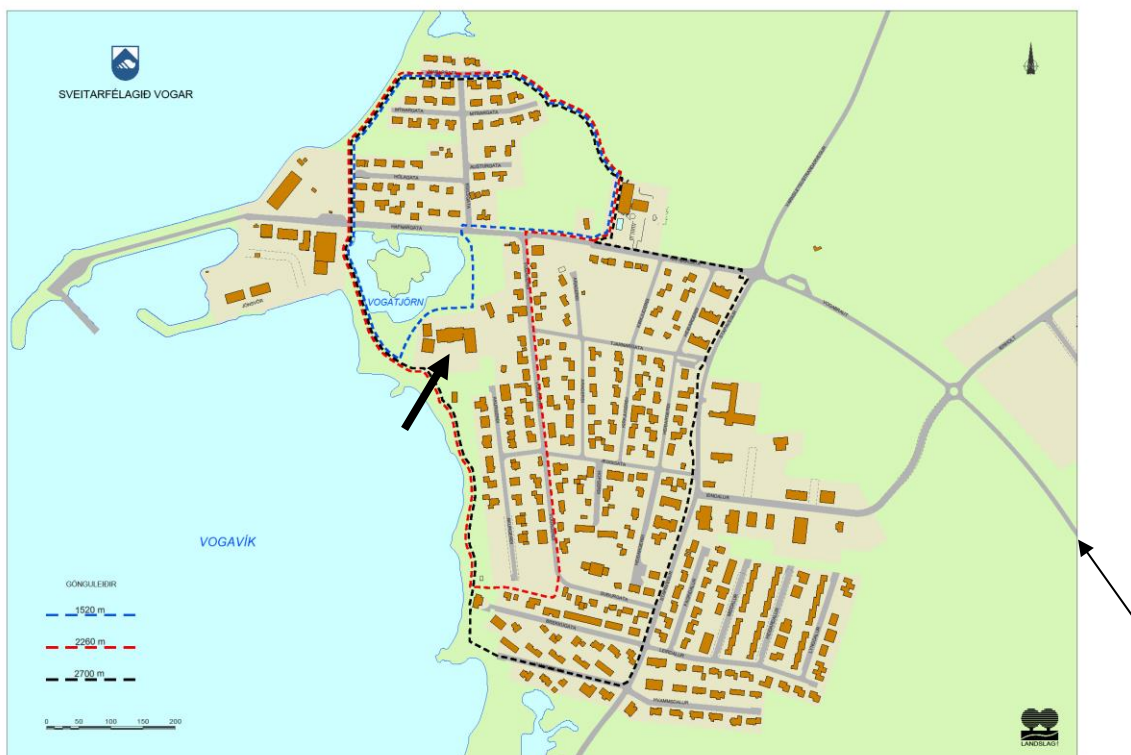
Mynd 1. Yfirlit yfir Vogana, svört ör vísar á Stóru-Vogaskóla.

Skólaárið 2019-2020 eru um 50 starfsmenn við skólann og frístundaheimilið. Nemendur eru samtals 172 í 1.-10. bekk.