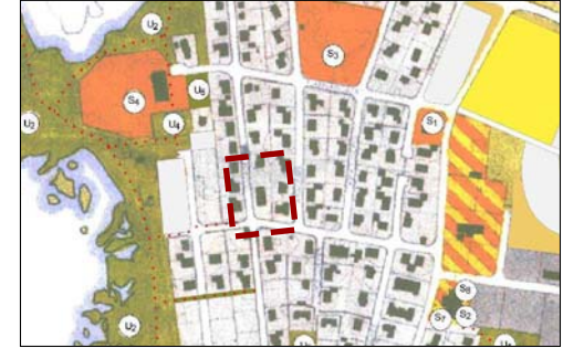
ADALSKIPULAG VATNSLEYSUSTRANDAHREPPS 1994 - 2014

Lóðarhafi skal hafa samráð við nágretta um frágang á sameiginlegum lóðarmörkum þeirra. Verði ágreiningur þar um, skal hlíta úrskurði byggingarnefndar í því máli.